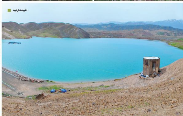
طبیعت دره بید