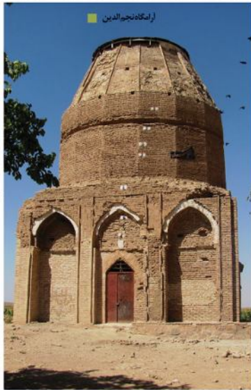
آرامگاه نجم الدین