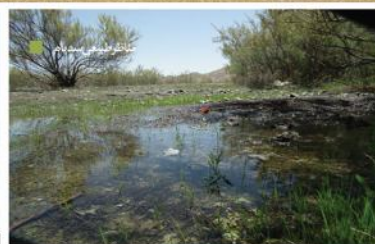
کلبه های آبریز