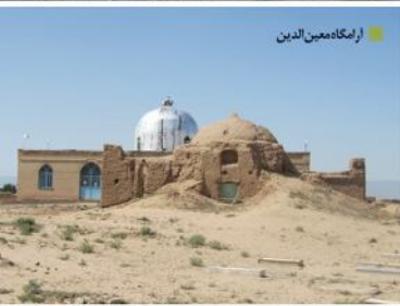
آرامگاه معین الدین