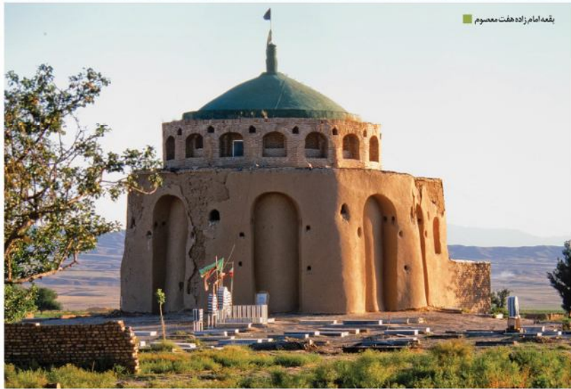
بقعه امام زاده هفت معصوم

منطقه حفاظت شده دوپرازک: این منطقه در فاصله ۳۵ کیلومتری شهر حکم آباد و ۵۵ کیلومتری شهر نقاب مرکز شهرستان جوین قرار گرفته است. عرصه کویری حکم آباد: واقع در شمال شهر حکم آباد شامل درختان تاغ و بوته های شورسند. طبیعت دره پلنگان: این عرصه در فاصله ۶۵ کیلومتری شهر نقاب و در ۱۲ کیلومتری جنوب سد یام واقع شده است.