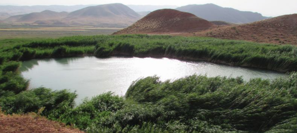
دریاچه سی سر