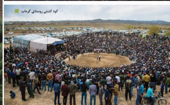
گود کنتی روستای گرماب