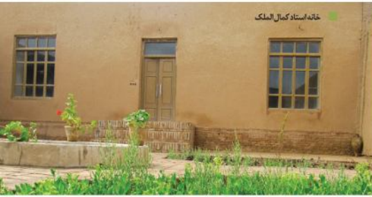
خانه استاد کمال الملک