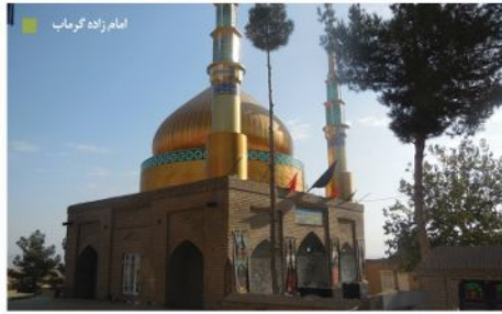
امام زاده گرماب

کویر رهن کاریز: منطقه کویری روستای رهن کاریز با پوشش تاغ در فاصله حدود ۲۵ کیلومتری جنوب شرق شهر فیروزه و در مسیر جاده تهران مشهد واقع شده است.