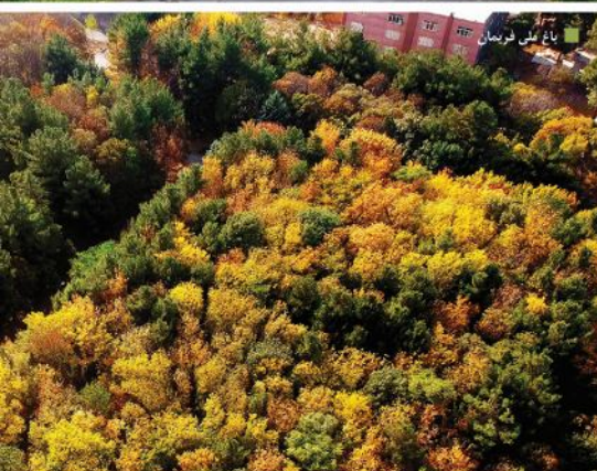
باغ ملی فریمان