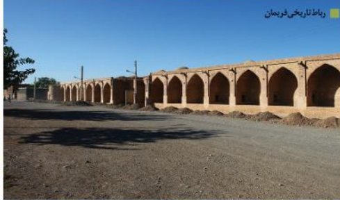
رابط تاریخی فریمان