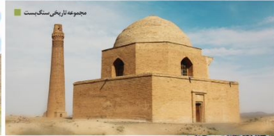
مجموعه تاریخی سنگ بست