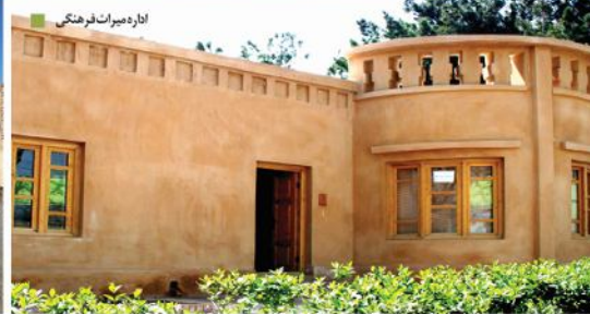
اداره میراث فرهنگی