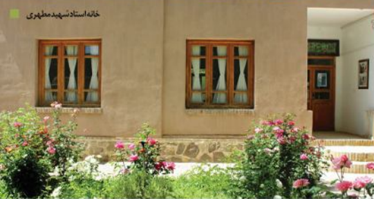
خانه استاد شهید مطهری