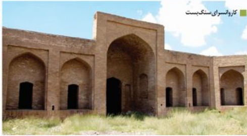
کاروانسرای سنگ بست