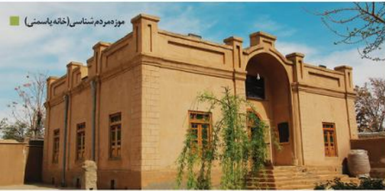
موزه مردم شناسی (خانه یاسمنی)

قلعه قاجاری حسن آباد: واقع در یک کیلومتری شرق شهر قلندرآباد و آثار دیگر... ایوان مزار رزمگاه، حمام قدیمی قلندرآباد، مزار بی آبه، آب انبار سعدآباد، حوض انبار سفید سنگ و مسجد قدیمی روستای استخر