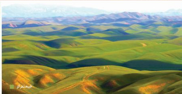
پارک ملی تندوره