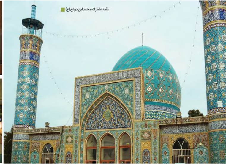
بقعه امام زاده محمد ابن دیاج (ع)

رودخانه های جاری درگز: شهرستان درگز دارای دو رودخانه جاری درونگر سرچشمه گرفته از کوه های شارک و آسلمه و زنگلاتلور در ۲۰ کیلومتری جنوب شرقی شهر درگز است تفرج گاه چرلاق: این منطقه کوهستانی در فاصله ۲۸ کیلومتری غرب درگز و در ۵ کیلومتری روستای جشن آباد واقع شده است. آبشار گرني: واقع در ۳ کیلومتری روستای دربندی علیا (بخش چاشلو - دهستان میانکوه) که محل استخراج های پرورش ماهی و ماهی گیری است. مناطق گردشگری روستایی: روستا و دره دربندی و پلکانی ریشخوار (۶۰ کیلومتری درگز)، آبگرم روستای هدف گردشگری داغدار (۱۸ کیلومتری جنوب شهر درگز) صنایع دستی: از مهم ترین هنرهای سنتی و بومی این شهرستان می توان به قالی بافی، ابریشم بافی، چرم دوزی، پوستین دوزی، بافت گلیم و جاجیم و... اشاره کرد سوغات درگز: کشمش، جارو، سیر، برنج درونگر محصولات لبنی و روغن زرد کردی به عنوان سوغات درگز شناخته می شود.