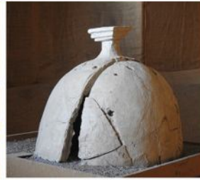
محوطه تاریخی بندبان