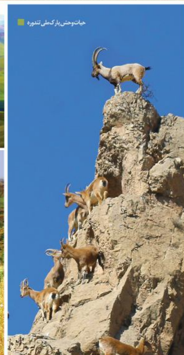
حیات وحش پارک ملی تندوره