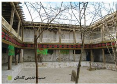
حسینیه قدیمی گلکمان