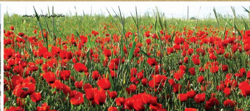
مناظر طبیعی کوهپایه های هزار مسجد