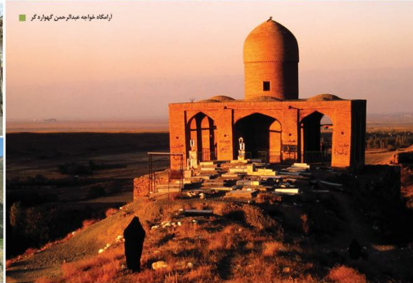
آرامگاه خواجه عبدالرحمن گهواره گر