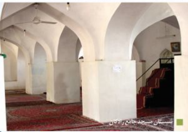
مسجد جامع رادکان

روستای هدف گردشگری رادکان: این منطقه بعد از هجوم مغولان به تدریج از شهری آباد به شکارگاهی برای آنها تبدیل شد و به تدریج متروک ماند. از جمله جاذبه های تاریخی آن نیز باید از یخدان قاجاری، بنای مسجد جامع و بقایای قلعه تاریخی نام برد.