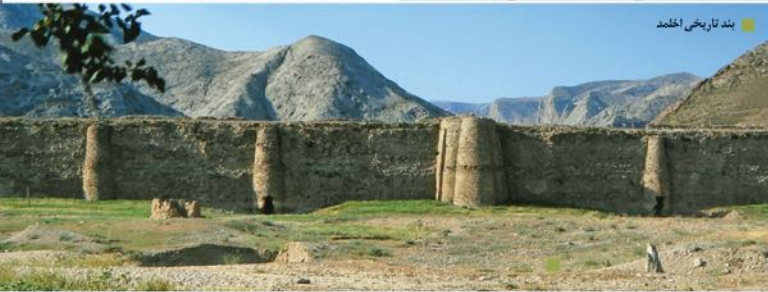
بند تاریخی اخلمد