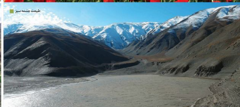
طبیعت چشمه سبز